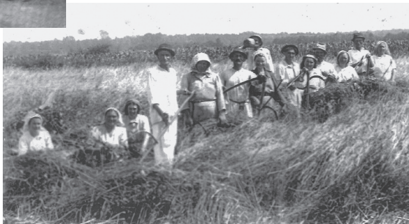
Žetva četrdesetih godina 20. st.