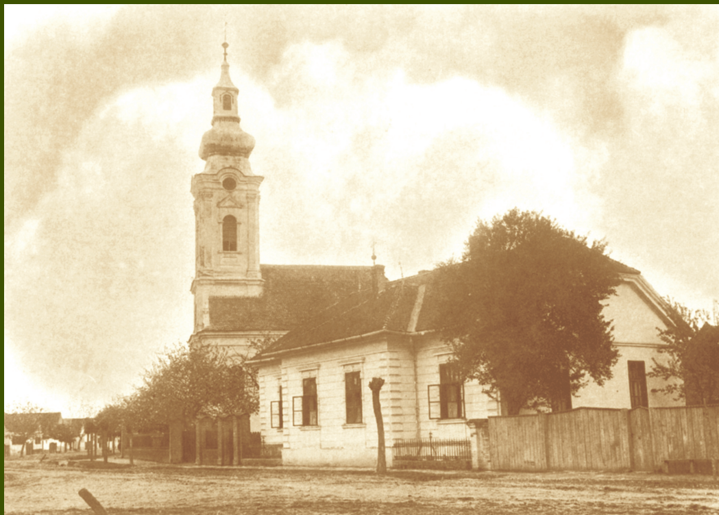
Župna crkva sa župnim stanom 1920. godine.