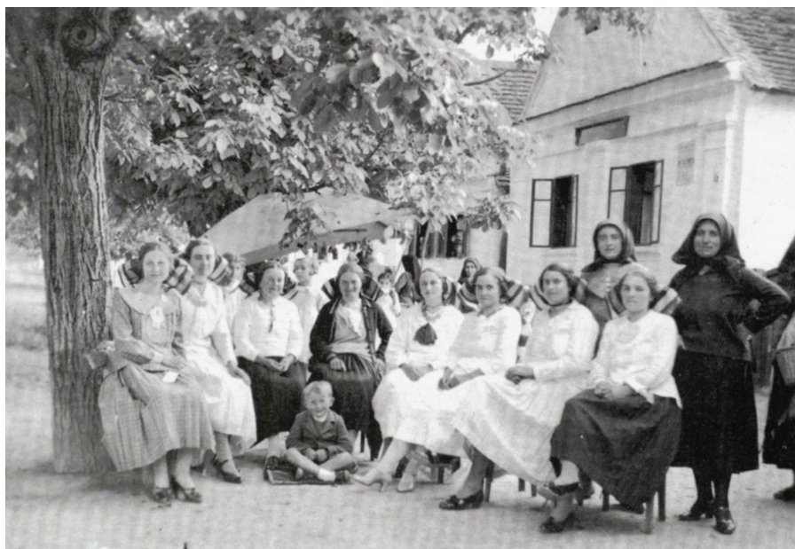
Ispred Hrvatske čitaonice tridesetih godina dvadesetog stoljeća