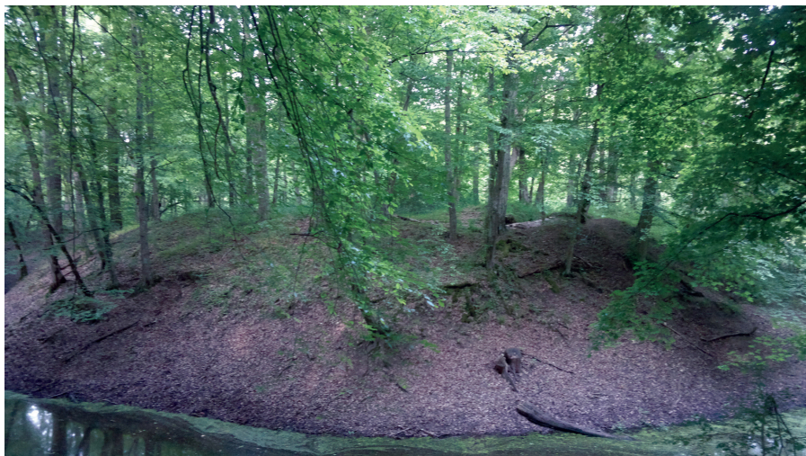
Zvizdan grad i opkop