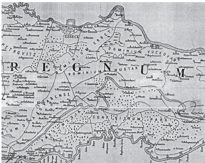
Zemljovid iz 18. stoljeća

Samo selo Paovo nalazilo se uz Paovsku baru sa sjevero-istočne strane prema šumi i uz Paovske livade koje su se prostirale također sjevero-istočno od Paovske bare.