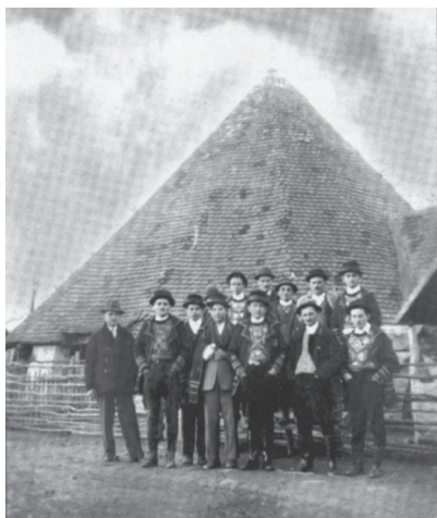
- Prid Reminom suvačom - Pripadnici Pjevačkog zbora 1937.