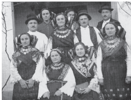
Članovi Seljačke sloge tridesetih godina