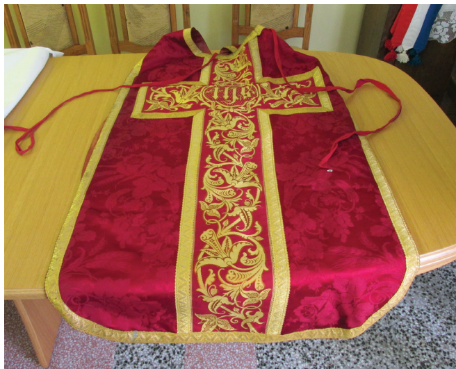
Misnica sa kraja 19. stoljeća