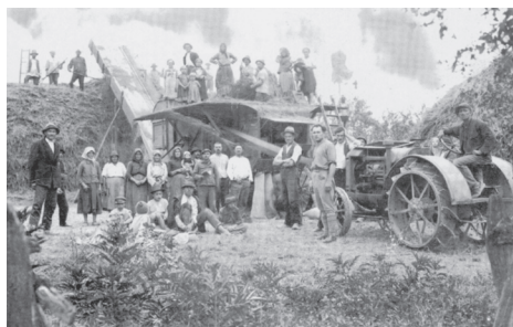
Vršidba na Filjiinom guvnu tridesetih godina