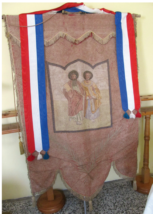
Barjak svetih Kuzme i Damjana