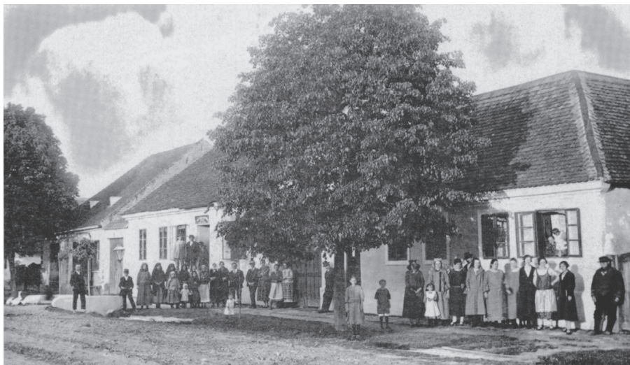
Prid Općinom i bilježnikovom kućom dvadesetih godina 20. st.