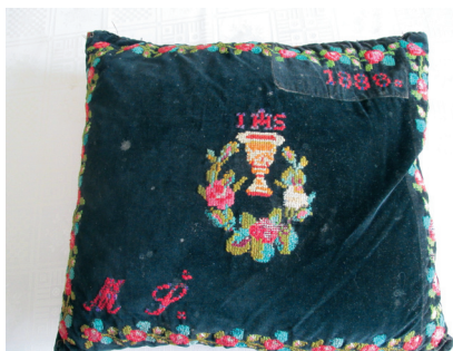
Crkveni jastučić iz 1888. godine