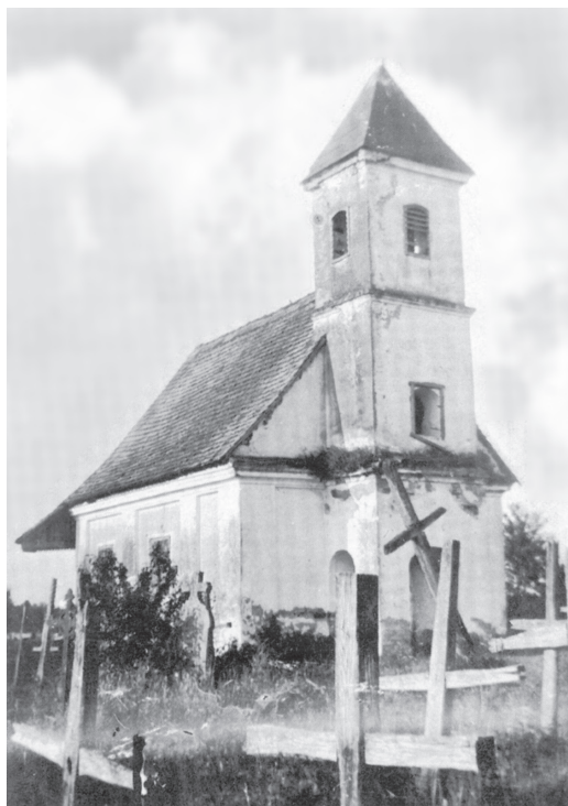
Crkva na groblju Popovci

Velika rudina istočno od Soljana, na soljanskom hataru, prema Strošincima zove se Popovci. Na njoj se nalazi staro groblje Popovci koje je stoljećima imalo, najprije drvenu crkvu, a onda zidanu 1824. potpuno jednaku kao što je ona na Šumanovcima koja je građena 1822. U 14. stoljeću franjevački samostan u Alšanu razvio je veliku aktivnost ali rezultati su bili slabi u pogledu