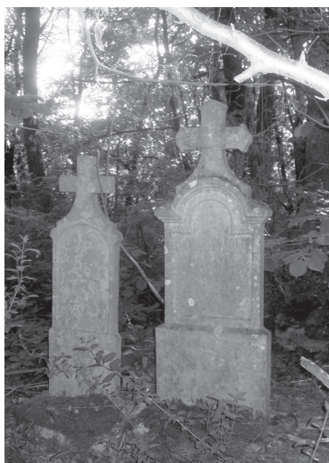
Detalj sa groblja Popovci