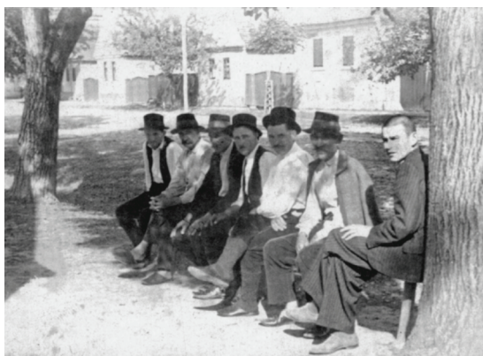
Na klupčici početkom četrdesetih godina